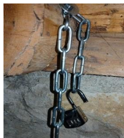
une chaîne avec cadenas