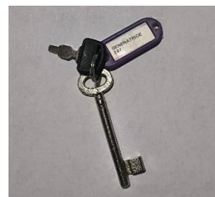
une clef local et une génératrice