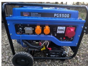
Une génératrice (réservoir plein)